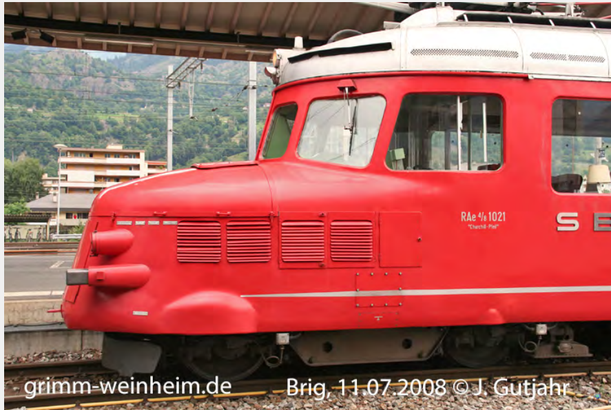
grimm-weinheim.de Brig, 11.07.2008