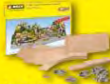
Easy-Track Trassenbausatz „Andreastal“

Mit Neuheiten von ZIERDES sowie unserer Partner KATO, Athearn und Rokuban