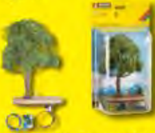
micro-motion Baum mit Schaukel