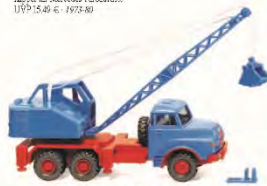
0662 06 Kranwagen (MAN/Piella) Wendiger Lasten-Vehikel UVP 25,99 € - 1969-68