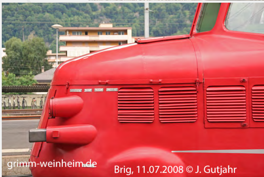
grimm-weinheim.de Brig, 11.07.2008