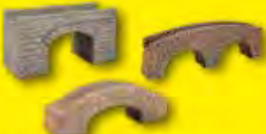
Brücken aus Struktur-Hartschaum