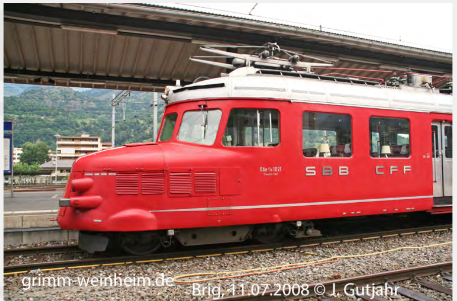
grimm-weinheim.de Brig, 11.07.2008